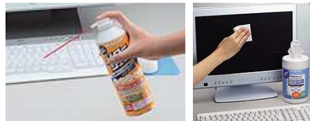
(*)「エアードスター」はサンワサプライの商品名です。エレコムでは「ダストブローア」と言う商品名です。

インクジェットプリンタはノズルのチェックをしましょう。プリンタの説明書に従い、「 テストパターン印刷 」と「 ヘッドのクリーニング 」を行いましょう。給紙口のホコリを取り除いておく事もお忘れなく!スキャナの掃除はなんとと言っても原稿を載せる台、 ガラス面の掃除 です。濡れ雑巾で拭くと、糸くずなどが残りますので、 OAティッシュ など、なるべく専用品を使用しましょう。